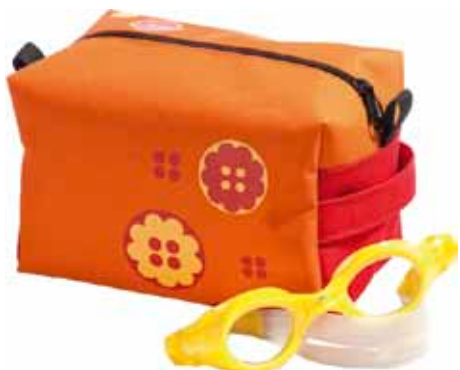
Reipaspussukka Nappi • 5125-2-1