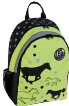
Heppa lime • 1184-1-6