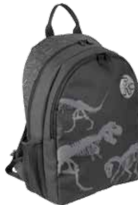
Saurus • 1184-1-13