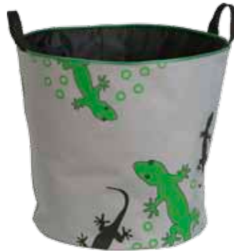
Salamanteri PikkuJemma • 7024-1-4 PuoliJemma • 7024-2-4 IsoJemma • 7024-3-6