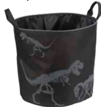
Saurus PikkuJemma • 7024-1-6 PuoliJemma • 7024-2-7 IsoJemma • 7024-3-10