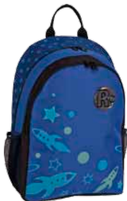
Raketti • 1184-1-3