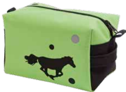
Reipaspussukka Heppa • 5125-2-2