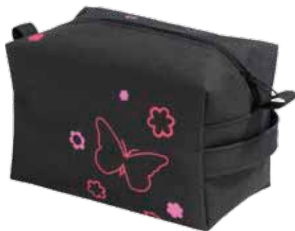
Reipaspussukka Perho • 5125-2-6