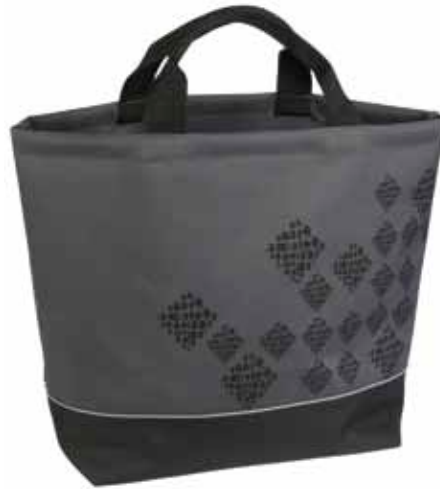
Ostokassi Salmiakki • 308-25-3