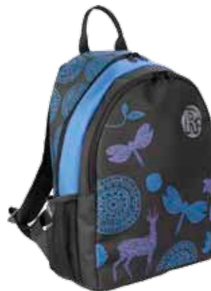
Tarina • 1184-1-12