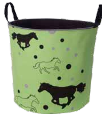
Heppa Lime IsoJemma • 7024-3-8