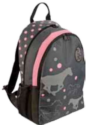
Heppa pinkki • 1184-1-10