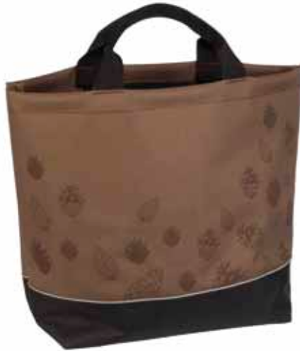
Ostokassi Käpy • 308-25-2