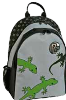
Salamanteri • 1184-1-4