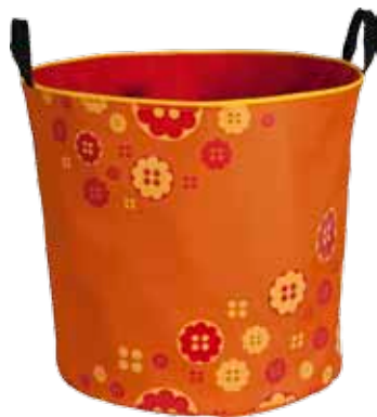
Nappi IsoJemma • 7024-3-2