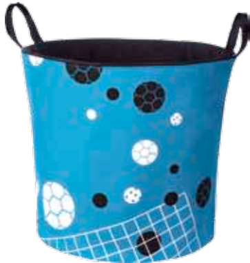
Sportti Isojemma • 7024-3-7