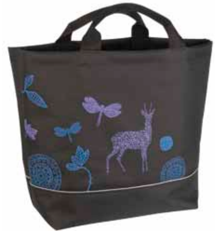
Ostokassi Tarina • 308-25-1