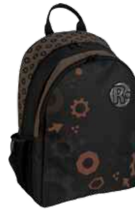
Mutteri • 1184-1-8