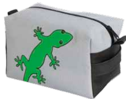
Reipaspussukka Salamanteri • 5125-2-3