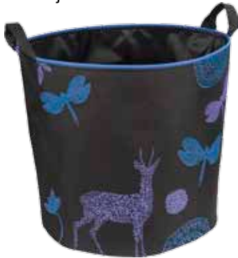
Tarina PikkuJemma • 7024-1-5 PuoliJemma • 7024-2-6 IsoJemma • 7024-3-9