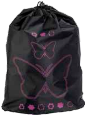
Jumppapussi Perho • 2671-2-1