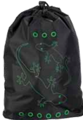
Jumppapussi Salamanteri • 2671-2-4