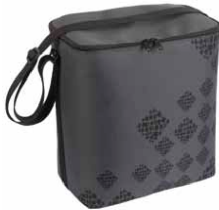
IsoEväs Salmiakki • 4990-1-8