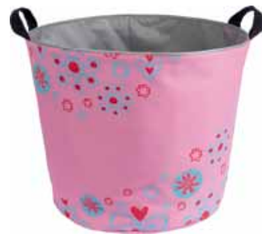
Hippi PikkuJemma • 7024-1-1 PuoliJemma • 7024-2-1 IsoJemma • 7024-3-1