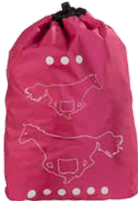
Jumppapussi Heppa • 2671-2-2