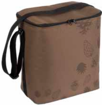
IsoEväs Käpy • 4990-1-7

Myyntihinta 30 € 10 € Euroja talkoisiin!