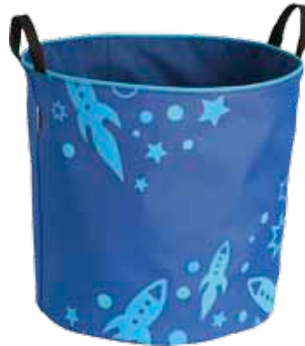
Raketti Isojemma • 7024-3-4