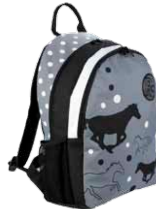
Heppa harmaa • 1184-1-11