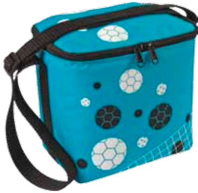
PikkuEväs Sportti • 7001-4-5

Pehmeä PikkuEväs taikuu kätevästi kasaan!