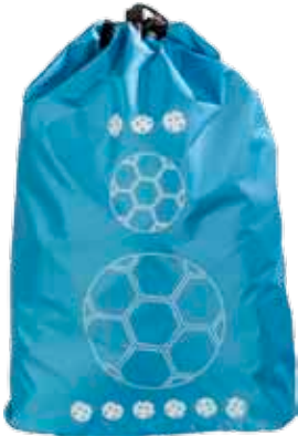
Jumppapussi Sportti • 2671-2-3