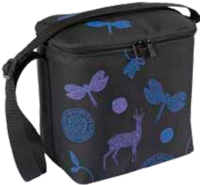
PikkuEväs Tarina • 7001-4-6