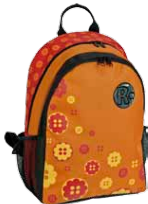
Nappi • 1184-1-9