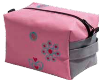
Reipaspussukka Hippi • 5125-2-5