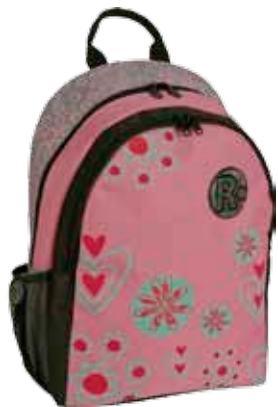
Hippi • 1184-1-2