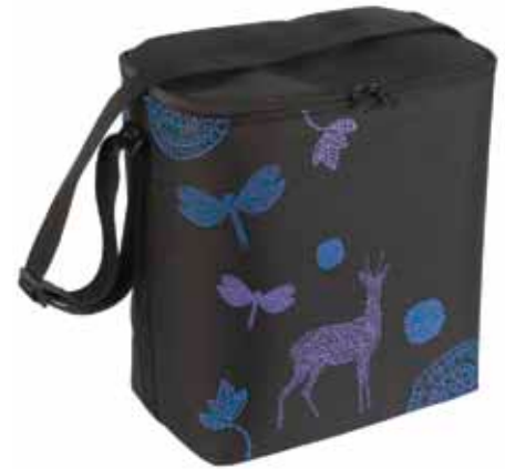
IsoEväs Tarina • 4990-1-6