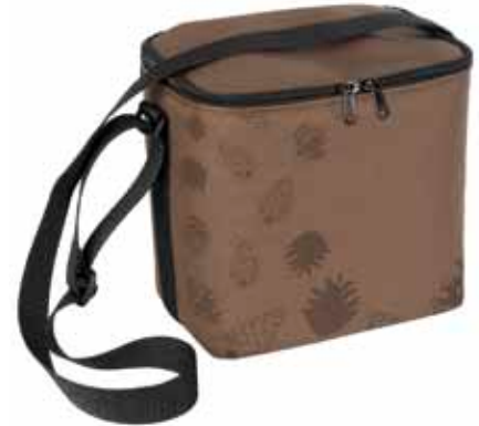
PikkuEväs Käpy • 7001-4-7