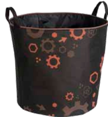
Mutteri Isojemma • 7024-3-5