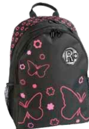
Perho • 1184-1-7