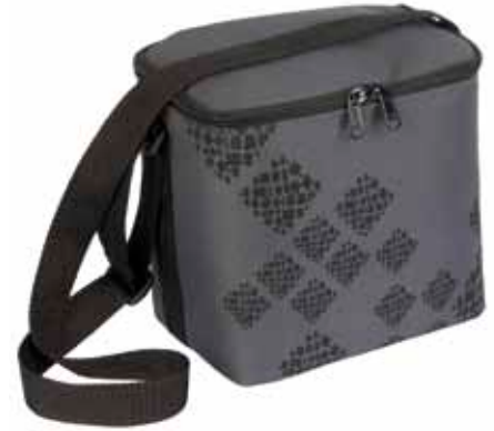
PikkuEväs Salmiakki • 7001-4-8

Pehmeä PikkuEväs taikuu kätevästi kasaan!