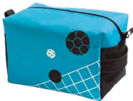
Reipaspussukka Sportti • 5125-2-4