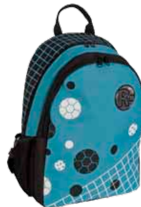
Sportti • 1184-1-5